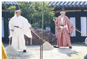
一番立・弓太郎・弓太郎相手

1月13日住吉大社に於いて、御結鎮祭弓神事が催されました。今年は久しぶり「神館」の前庭で行われ観覧が許可されたこともあって大変賑やかでした。府連有志27名の方々がご奉仕させて頂きました。