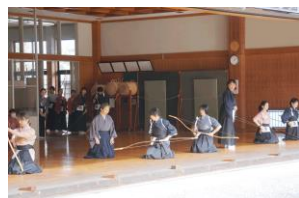
射技指導・射技の要点等