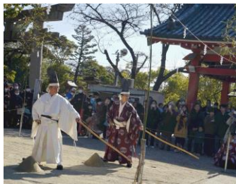
一番立・弓太郎・弓太郎相手