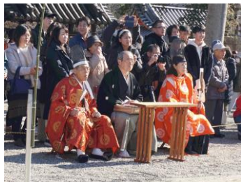
奉行と後方は観覧者

1月2日堺市百舌鳥八幡宮において古式弓道射初式があり、府連有志23名がご奉仕しました。今年の百舌鳥八幡宮は温かな日とでコロナも昨年、五類になったこともあり、初詣の方が本殿の前に行列をなしていました。開始時間の前から大勢の初詣の方が的の近くまで集まり、警備員の方が整理に当たる程の人出でした。