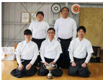
優勝パナソニックチームの選手