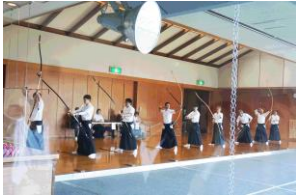
世界弓道大会予選会