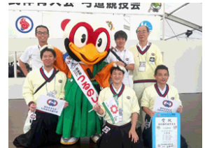
国体参加選手一同