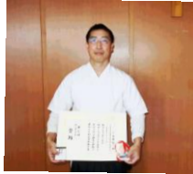
近畿大会個人戦3位