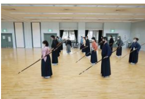
枚方講習会の様子