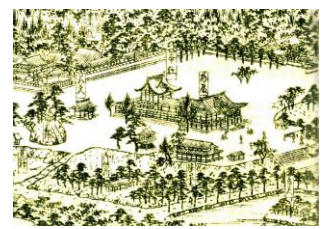
百舌鳥八幡神社平安時代古図