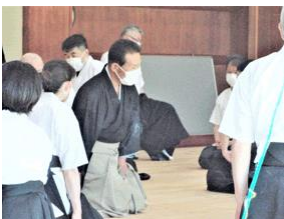
万博講習会の様子

射技指導、基本の姿勢・動作の反復練習、矢番え動作・肌脱ぎ・襷掛けなど、気温が上がり、蒸し暑い中、各会場共に熱心に稽古が行われました。