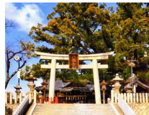
百舌鳥八幡神社山門

(もず) 地域を表す表記には「百舌鳥」の他に「毛受」、「鷗」、「万代」など様々な字が充てられています。中でも万代は百舌鳥八幡にとって密接な関係のある表記です。平安時代末期には百舌鳥八幡宮は前述しました通り、京都石清水八幡宮の別宮となっていて万代別宮とされています。その後、万代八幡宮と称されるようになり、百舌鳥八幡神社とされる明治に至るまで万代の文字がつかわれていました。