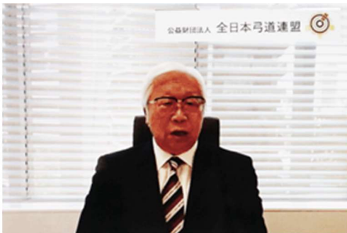
全日本弓道連盟 増田会長より挨拶

3月21日参加地連31チームをA~Dまでの4グループに分けて予選会で始まりました。