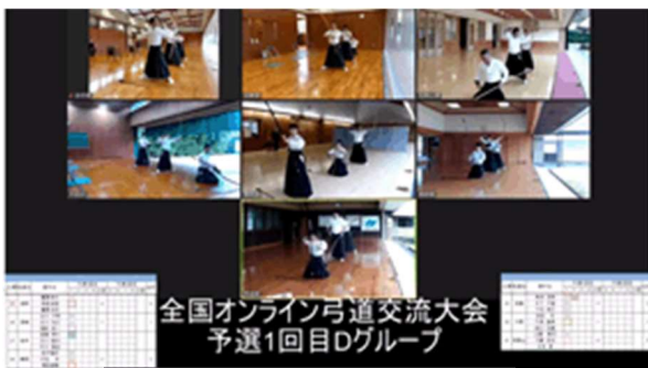
Dグループ予選1回目の様子