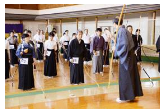
岸和田会場の稽古風景

『四段は大阪府連審査の最高段位の審査なんです、皆さんはそこを超えて来た人たちなんですから、自覚を持って今日の講習に臨んで下さい』。四段の参加者は8名でした。仕上げは「三人一つの射礼」が行われました。