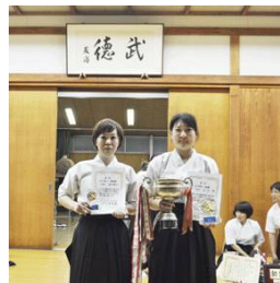
女子個人・優勝・準優勝