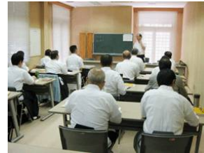
スポーツ指導員養成講習会開講式

12%(96名)が取得しているにとどまりません。本講習会は、毎年確実に開催されるものではなく、体協の審査があって、承認を受けて初めて実施されるものです。次回、開催の折にはぜひとも多数の方の参加を期待致します。