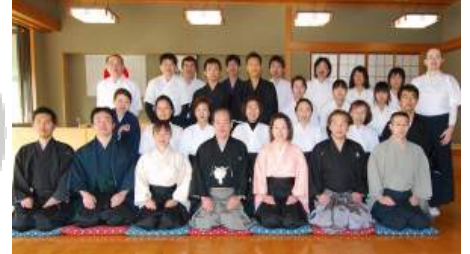
初射会に集う会友

真和弓友会は日本武徳会で活躍されていた有志 が集い、全日本弓道連盟ならびに大阪府弓道連盟 への参画を切望したことに始まります。