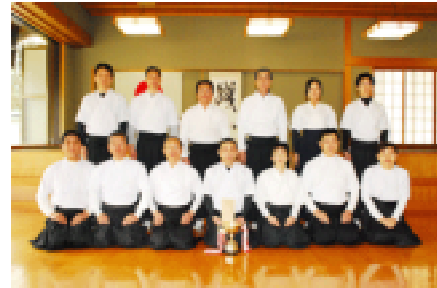
優勝チーム 万博弓友会

万博弓友会 堺弓道協会 高津弓友会 豊中市弓道協会 朝日弓友会 住吉弓友会 会 高槻弓友会 岸和田弓友会 加支多 八幡弓友会 八尾市弓道協会 真和弓友会