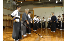
堺初芝講習の様子