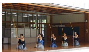
近畿連合会各地連会長 演武