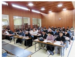
検定試験を待つ受講生

射手5人に指導者5人、評価者5人という構成で、持ち的射礼が行われました。最後に審査の要領で検定試験が行われ、受講者にとっては張りつめた一日に終始しました。