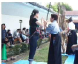
順番を待つ参加者

10月8日(祝)、各地でスポーツ体験会が開催され、今年は豊中市をお訪ねしました。昨年は、大阪城をお訪ねしましたが雰囲気随分と違っていました。豊中市は『生涯スポーツ』をスローガンに掲げておられて子供から高齢者の方まで人数制限はあるものの、何方でも自由に参加できる方法がとられ、今年はおよそ300名の方が参加されました。(昨年は市長も参加されたそうです。)