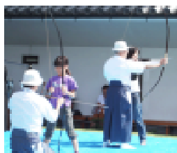
的中して驚いた女の子