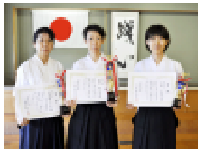
男女優勝～3位入賞の各選手