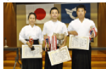
個人優勝及び入賞の各選手